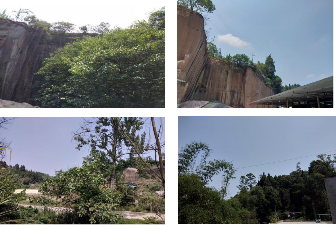
附图五：项目相关设施图